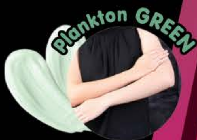
Plankton GREEN สีเขียวอ่อน ผิวโทนสีขาว ที่อยากปกปิด รอยแดง หรือผิวที่ไม่สม่ำเสมอ