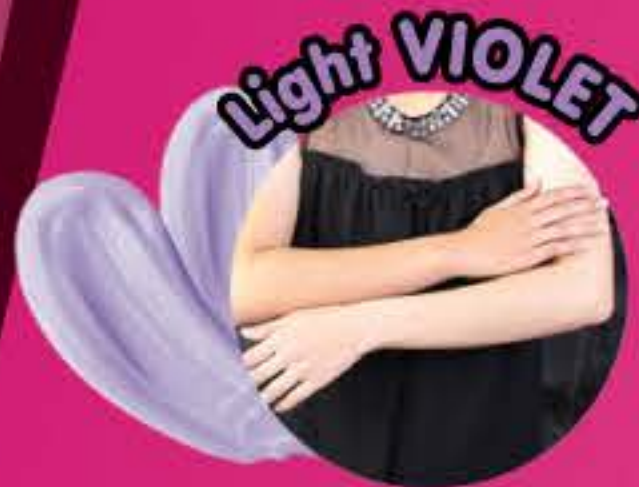
Light VIOLET สีม่วงอ่อน ผิวโทนสีขาวเหลือง