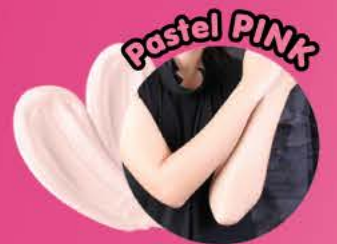
Pastel PINK สีชมพูน้อย ผิวโทนสีขาวซีด หรือขาวมาก