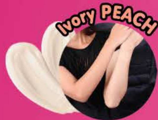
Ivory PEACH สีเบจพื้ช ผิวโทนผสม หรือผิวเข้ม